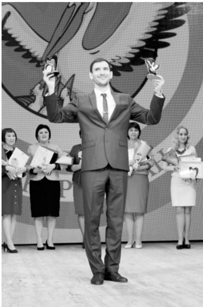
Получить главную награду - это приятно, почетно и очень ответственно!

Игорь ВЕТРОВ, по материалам образовательного портала Воронежской области