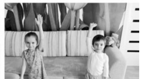
Педагоги детского сада №26 г. Донской Тульской области во время самоизоляции занимаются спортом с детьми